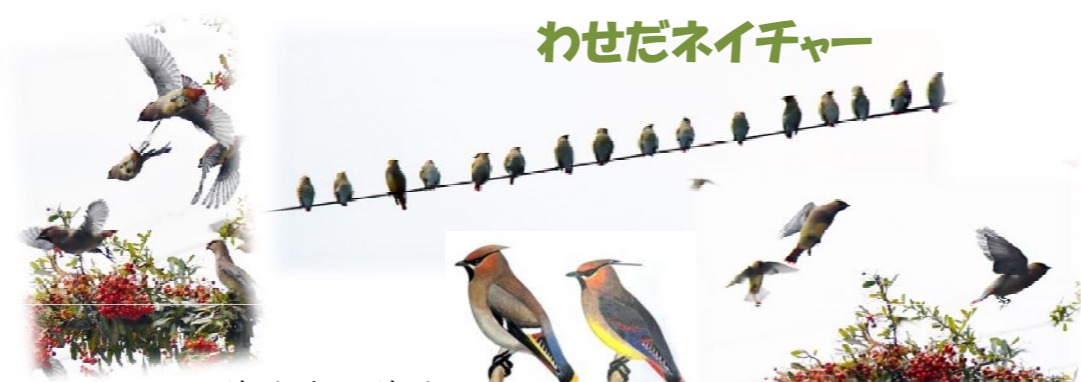
ヒレンジャク・キレンジャク