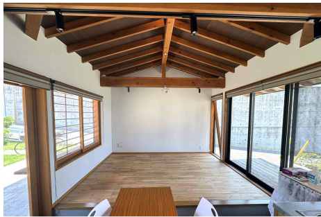
素足でくつろげる小上がり！！