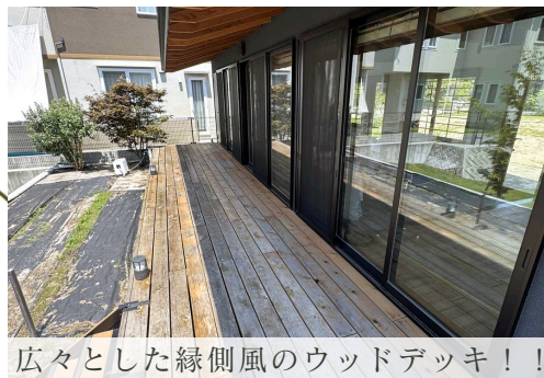
広々とした縁側風のウッドデッキ！！