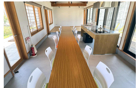
ワークショップや会議に！！