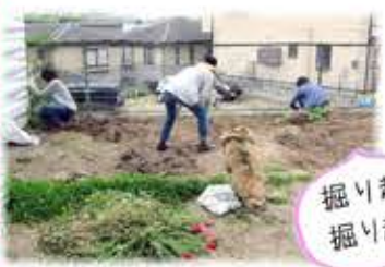
掘り起し掘り起し!

担当場所を●集会所●サロンよりみち●みち草カフェの3か所に区分けして、かわいいプレートも作りました。5月6日には新しいお花の苗を植えます。クローバーの花もたくさん植えています。また来所の折には見てくださいね。