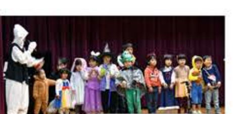
Kid's ABC 早稲田ちびっこクラブ