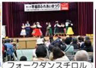
フォークダンスチロル