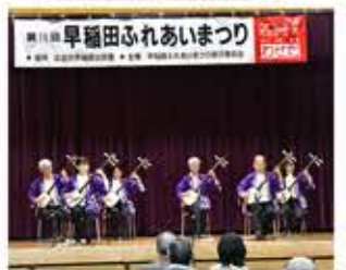
津軽三味線サークル