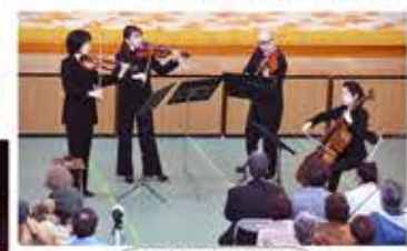
広島交響楽団 弦楽四重奏