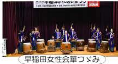
早稲田女性会華つゞみ

11月6日(月)、社協臨時総会を開催。「早稲田社協役員等の活動費に関わる規約の改正」について熱心に審議され、全員一致で可決承認されました。