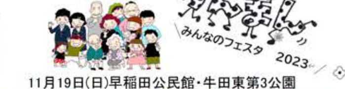
11月19日(日)早稲田公民館・牛田東第3公園