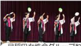
早稲田女性会グループわっせ