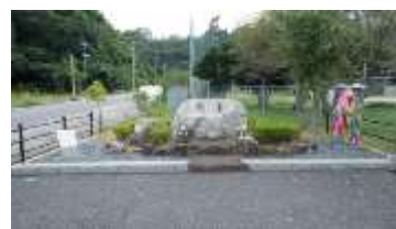
似島・原爆慰霊碑

フラワーフェスティバルの会場となっています。原爆投下の日も「学徒動員」で一中に登校し朝礼中に被爆しました。母は翌日から1週間毎日歩いて己斐峠を越し市内中心部に行き、兄を探したそうですが見つかりませんでした。夕方遅く疲れきって虚しく帰る母の気持ちを思うと、今でも辛くなります。その後一中から兄は広島湾に浮かぶ似島で8月8日死亡したとの連絡がありました。当時似島には陸軍第2検疫所が在り広島で被爆した約1万人が運ばれましたが、懸命な治療のかいもなくほとんどの人が亡くなり葬られました。兄もその中の一人だったのです。毎年8月になりますと両親は兄弟を連れて宇品からポンポン船に乗り慰霊碑にお参りに行きました。でも私達兄弟はお参りより海水浴が楽しみだったのを覚えています。戦争で命を落しても学徒動員は民間人扱いでしたが、昭和38年の閣議決定で軍人扱いとなり靖国神社に祭られております。そして私は同じ境遇の皆さんに少しでもお役立ち出来れば