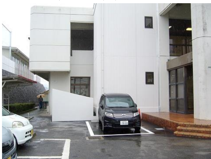
駐車スペース追加