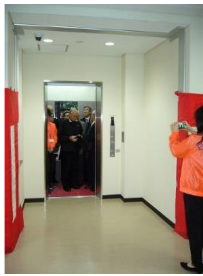
エレベーター試乗