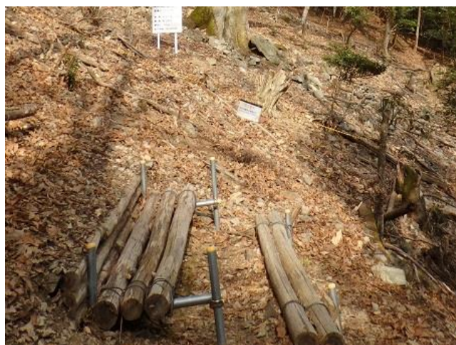
手作りのベンチが設置されている