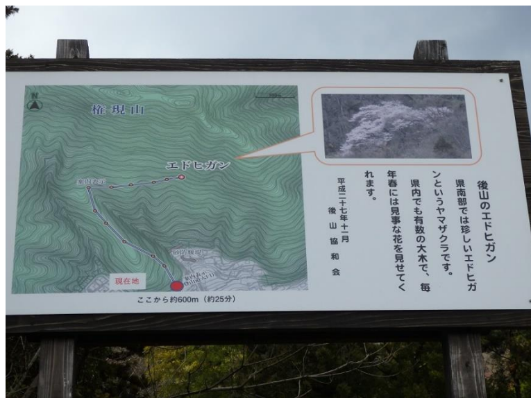
登山道入口に設置された案内板

後山協和会の方が案内板を設置したり、登山道や木の周りを整備したり、手作りのベンチまで設置したりしてくださっています。お蔭で今年も見事な花をゆっくり観賞することができました。