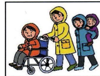
高齢者・病弱な人、体の 不自由な人には皆で協力を