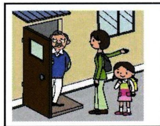
ひとり暮らしのお年寄り などには声をかけて