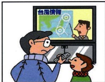
正確な情報収集を