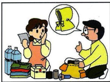
非常持ち出し品の準備を