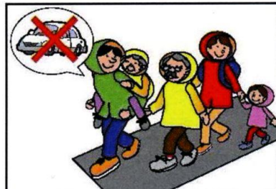
車での避難は控え、徒歩で避難を