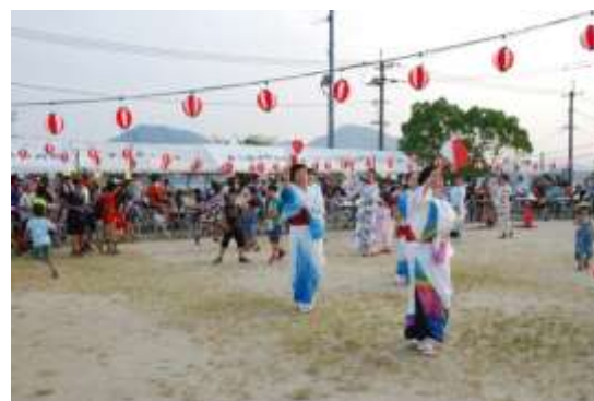
町民による盆踊り

準備の時より、区長・副区長・幹事さんをはじめ、多くのボランティアの方や支援隊の方の協力によ