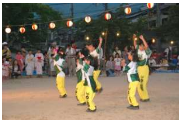
ヒップホップダンス