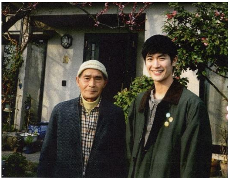
平成29年 青年俳優「三浦春馬さん」 を自宅にお迎えして

昨年はオリンピック聖火ランナーになることができた。平和公園を訪れられたバウハオリンピック会長とも面会し対話し、グータッチでお別れするような機会もいただいた。かって、若手俳優の三浦春馬さんが毘沙門台のこの家まで来てくれたこともあった。