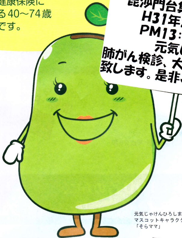
元気じゃけんひろしま21 マスコットキャラクター 「そらママ」

毘沙門台集会所に於いて H31年2月15日(金) PM13:30~14:30 元気じゃ健診 肺がん検診、大腸がん検診を実施 致します。是非ご参加ください