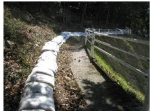
施工後の現場状況