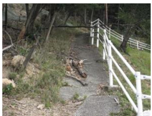
施工前の現場状況