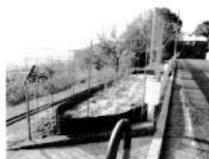
百段階段下りの花壇