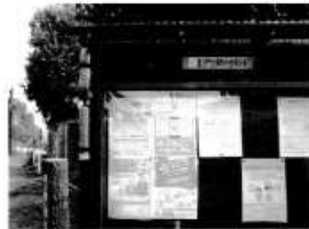
東公園掲示板の枠