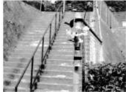
公園入口フェンス支柱