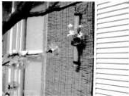
一般住宅の玄関近く