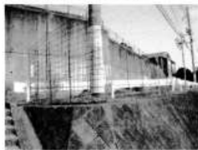
しゅりあちよーく上がり口の花壇