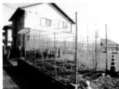
毘沙門天駐車場の花壇