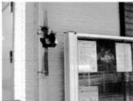
フラワーホール掲示板横