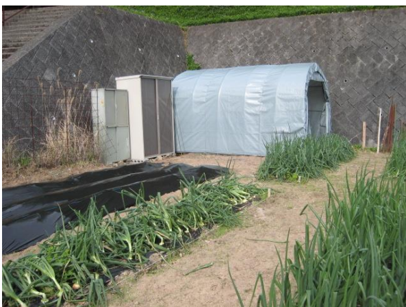
野菜畑内に組み立てが完了した諸資材収納テント