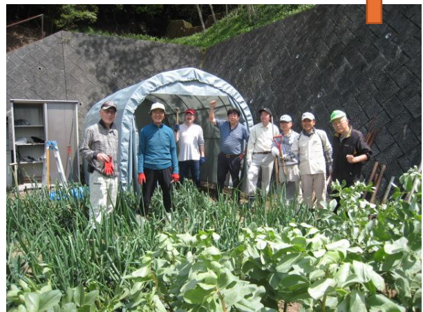
テント組み立て作業に参加した役員のみなさん