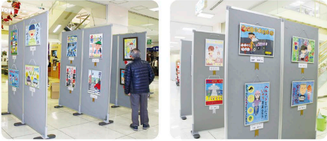
展示会場の様子(三次サングリーン)

昨年の11月26日(水)から今年1月23日(金)の期間、広島県東部運転免許センターをはじめ県内5会場において、小中学生を対象に昨年実施した交通安全ポスター・作文コンクールで広島県知事賞などを受賞したポスター優秀作品27点を展示し、多くの方々に鑑賞していただきました。ご協力いただいた会場施設の方々に感謝するとともに、大人も子どもたちの「交通安全の願い」を实践されますよう祈念いたします。また、次回のコンクールもすばらしいポスターや作文の応募をお待ちしています。