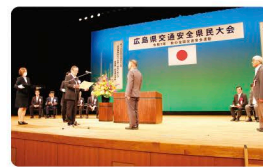
昨年表彰式の様子