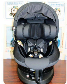
チャイルドシート(ISOFIX固定方式)