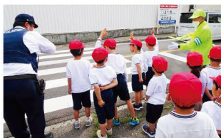
「正しい横断歩道の渡り方」の指導