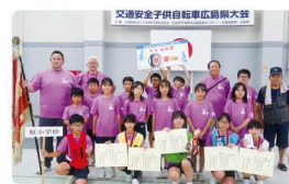
昨年優勝の原小学校チーム