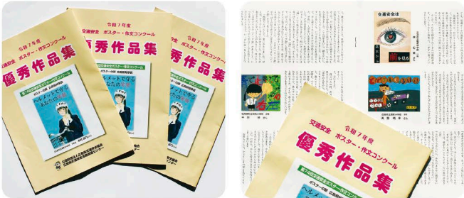
交通安全ポスター・作文コンクール優秀作品集

昨年の県知事賞受賞作品などを掲載(ポスター、作文各14点)した、「交通安全ポスター・作文コンクール優秀作品集」を発行しました。交通安全意識の啓発に役立てていただくよう、県内の小中学校や公立図書館などに配布しました。