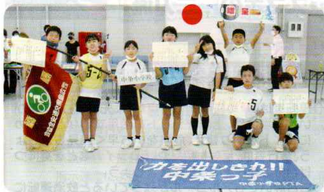
団体優勝した中条小学校チームのみなさん