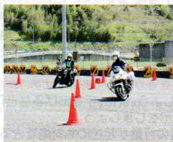
4月の講習会の様子