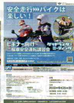
2022グッドライダー ミーティングチラシ