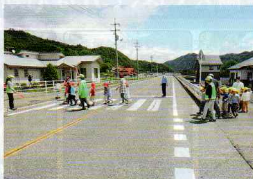
交通安全教室の様子

北広島町と安芸太田町を管轄している当協会は、自然豊かなこの土地で悲惨な交通事故を発生させない為に日々邁進しております。特に、山県郡は過疎化の進んだ地域のひとつでもあるので、高齢者に対する交通安全指導には力を入れております。その一つが毎年恒例の「グラウンド・ゴルフ大会」です。コロナ禍でこの2年は開催されませんでした、