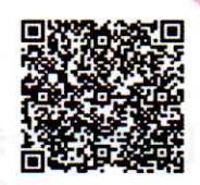
ホームページ QRコード

電話・FAX・E-mail・郵送・申込フォームのいずれかの方法でお申込みください。 センターホームページ内からお申込みできます。 広島市成年後見利用促進センターホームページURL ( https://shakyo-hiroshima.jp/kurashi/center.php ) ※ 電話でのお申込みは、土日祝を除く8:30～17:15に受け付けています。