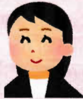
センター長 社会福祉士