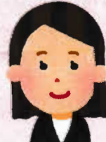
看護師 主任介護支援専門員