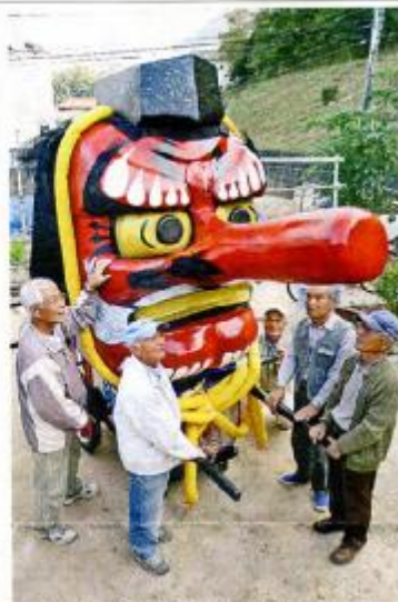
秋祭りで披露するてんぐの特大明こし