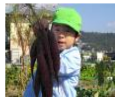
こっちもスゴイゾ!!