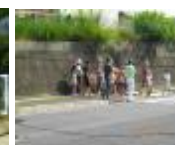
ウォークラリー出発