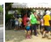
ウォークラリーゴール