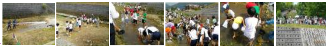
鮎放流場所の清掃 鮎の放流 鮎のつかみ取り 鮎より人の数が多い? 鮎も必死? 難しかったね 心配気に高みの見物?

ついで ◎わがまちの沿革 ◎可部線電化延伸を目指して!! ◎螺山の登山案内 ◎女性会の活動 ◎第3回写真展特集 ◎安心・安全なまちづくりを目指して!! ◎災害に強いまちづくりを目指して!! ◎地域かわら版 ◎わがまちの名所・旧跡・ホットスポット ◎祭りだワッショイ・ワッショイ特集 ◎とんど ◎地図 ◎まちのお知らせ ◎まちの会議室 ◎アンケート ◎まちのカレンダー ◎まちのアルバム ◎緊急のお知らせ ◎広島市からののお知らせ ◎区役所からののお知らせ ◎検索 ◎リンク集