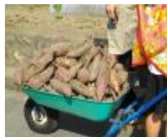
台車に3台もとれました