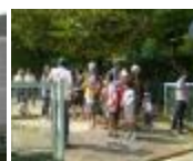
ウォークラリー出発前