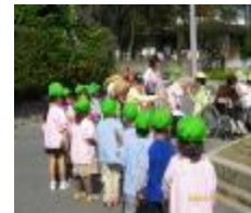
ホームの皆さんに全員で報告