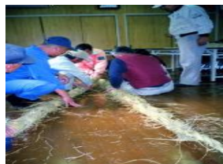
力を合わせて3本を均等に織る事が重要です 完成した注連縄を山崎神社に奉納 新年を迎える準備の整った山崎神社