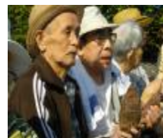
収穫したサツマイモを手にして