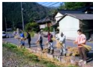
作業となるモチワラの選別

この注連縄作りは当地区の年中行事として毎年年末に行われており、今後とも引き継いでいきます。なお、前年の古い注連縄は、『とんど』で焚き上げます。