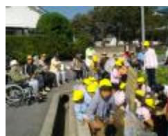
子ども達の作業を見守る皆さん