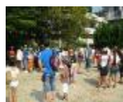
ウォークラリー受付