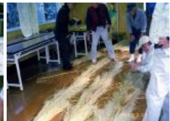
作業着手前の段取りが大切ですね