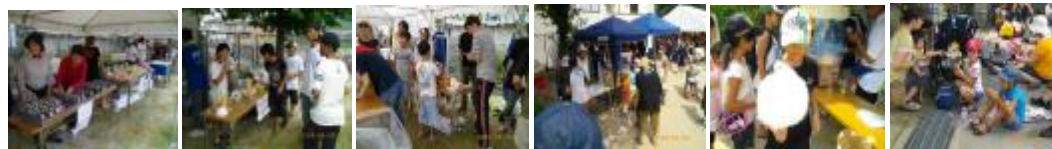
真剣なおむすび売り場 すじ肉と唐揚げは如何 かき氷売り場は大盛況 綿菓子売り場で 大きな綿菓子でした ママと一緒にお弁当