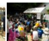
ウォークラリー成績発表