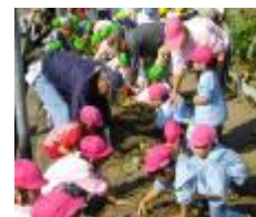
これから芋掘りの開始