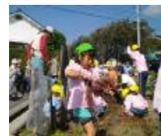
こんなに沢山下ら下がっているよ