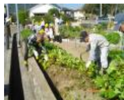
芋蔓の取り除き作業