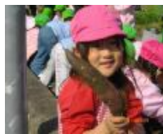
こんなに大きいよ!!