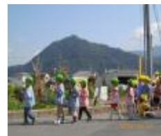
高松山を背に帰園です