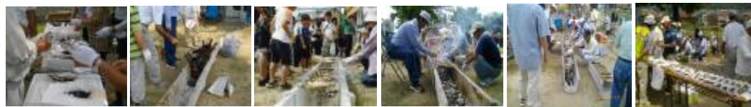
捕えた鮎の下こしらえ 鮎焼き炉の下準備 鮎焼き風景～1 鮎焼き風景～2 鮎焼き風景～3 塩焼き鮎の販売