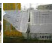
ウォークラリー組合表