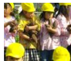
ガンバって抱えています