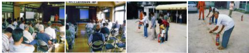
安佐北消防署員の防火講話を熱心に受講する参加者

河戸地区は今年度第2回目の防災訓練です。第1回は平成21年6月28日(日)に近隣避難場所への避難訓練で、その時の参加者は300名でした。