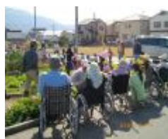
今日はお天気で良かったですね