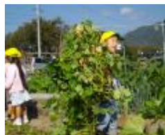
芋蔓の運搬 がんばってます