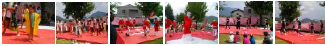
南中ソーラン～1 南中ソーラン～2 ひよっこおどり～1 ひよっこおどり～2 ヒップホップダンス～1 ヒップホップダンス～2