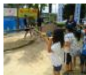
水鉄砲で遊ぶ子どもたち