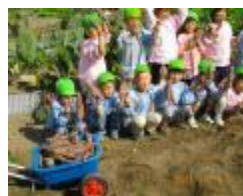
こんなにとれたよ!!