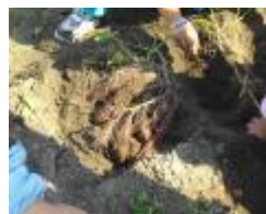
顔を出したサツマイモ