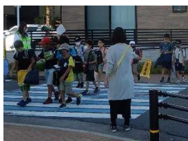
保護者見守り当番