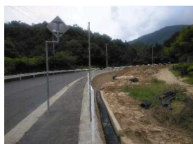
復旧した梶毛ダム横市道