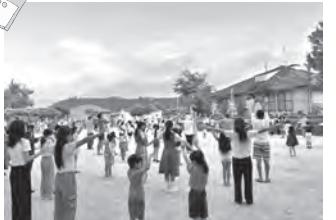
東街区参加人数: 1098名