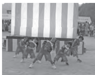
ダンスポートのヒップホップダンス