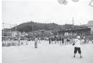
西街区参加人数: 631名