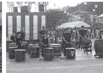
鬼城太鼓の迫力ある太鼓の響き