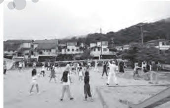
南街区参加人数: 426名