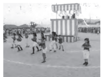
ヒップホップスマイルのダンス