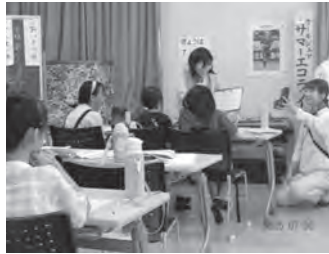
出席の児童にインタビュー

7月30日RCC「ごぜん様さま」にて西集会所でのエコ教室を「13年目の緑のカーテン」と題して放送された。約6分間の冒頭、