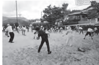
緑街区参加人数: 414名