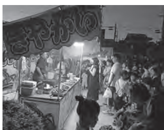
イカ焼きに長蛇の列