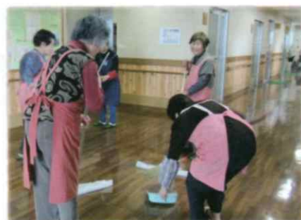
【寿老園訪問グループの活動中】