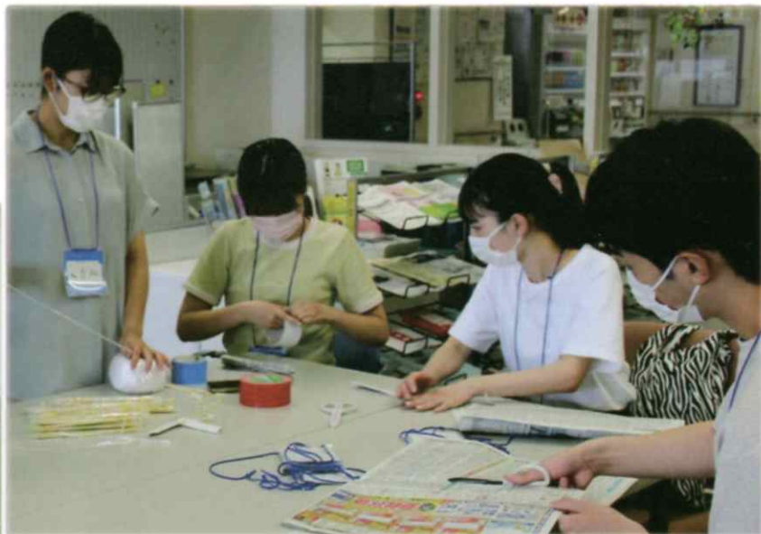
【2日目 ちやいちやい夏祭りの準備中】