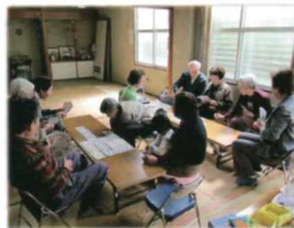
【ひまわり会のサロンの様子】