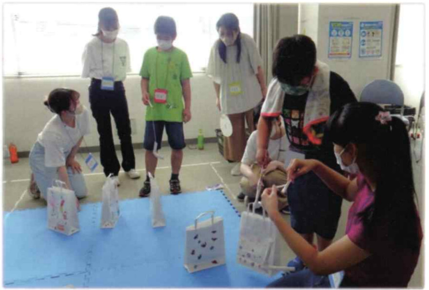
【3日目 スタンプを全部集めてお菓子釣りに挑戦!】

多くの受講生の感想で、講座に参加する前と後で、障がいに対する考え方やボランティアに対する意識が変わったとの回答がありました。