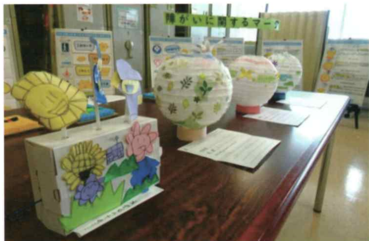
↑素敵な作品がたくさん並んでいます 障がいマークを紹介しているパネルです→

東区社協では、毎年12月を障がい理解の啓発月間とし、東区総合福祉センター4階に設置しています。知的障がいを学べるパネルや、障がいマークを学べるパネルなどを展示しておりますので、ぜひご覧ください。