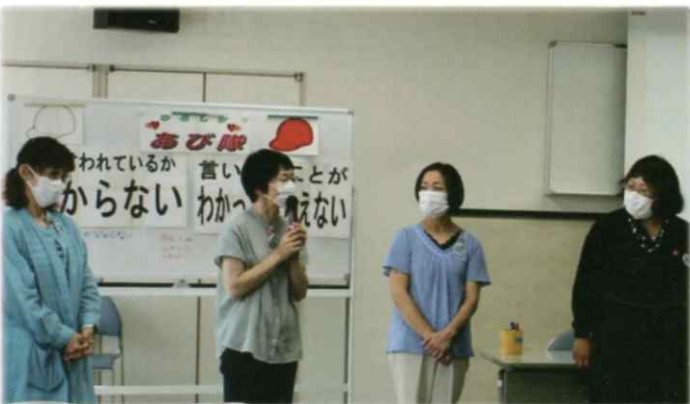
【1日目 講師の広島市手をつなぐ 育成会 「ひろしま♡あび♡隊」の皆さん】